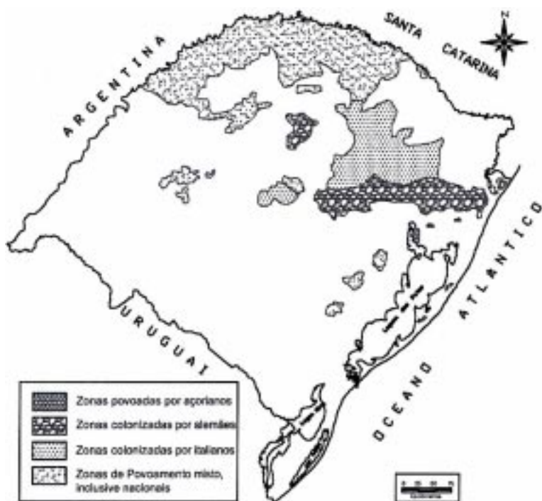
Figura 1 - Zonas de povoamento do Rio Grande do Sul

Fonte: Thomas, C. "Conquista e povoamento do RS", 1976 Adaptação: Geógrafos Jussara Mantelli e Sidnei Bon Gass