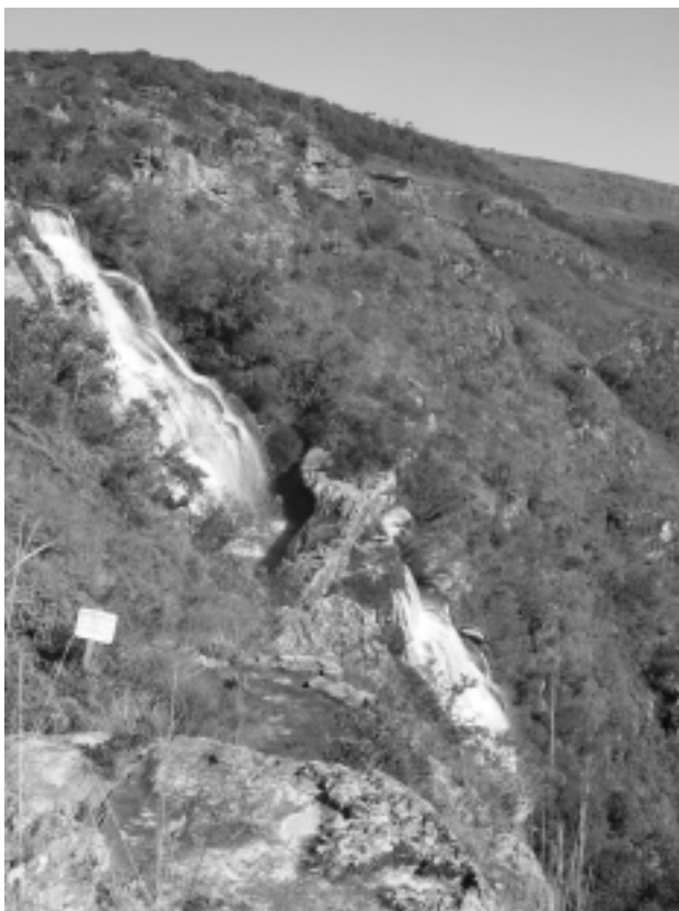
Figura 5 – Formação geomorfológica – crê