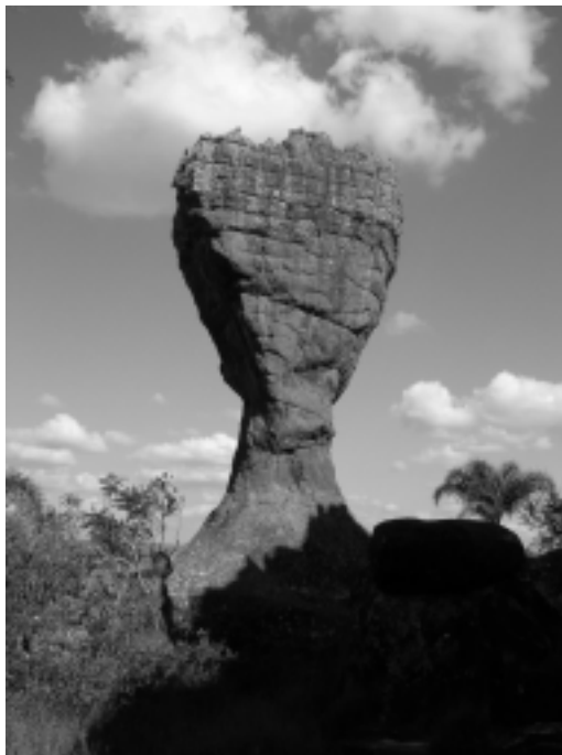
Figura 3 – Forma arenítica