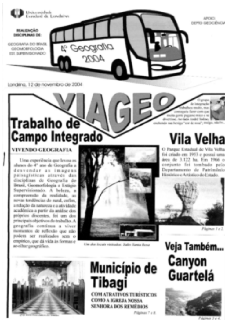
Figura 6 – Jornal informativo