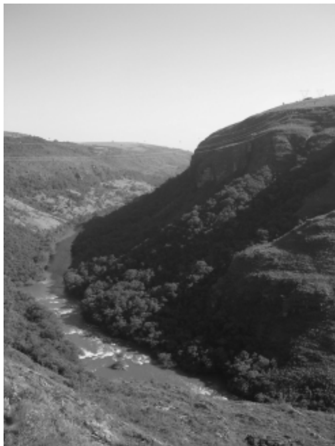
Figura 4 – Canyon do Guartelá

As figuras 4 e 5 apresentam algumas características da área que compreende o Parque Estadual do Guartelá.