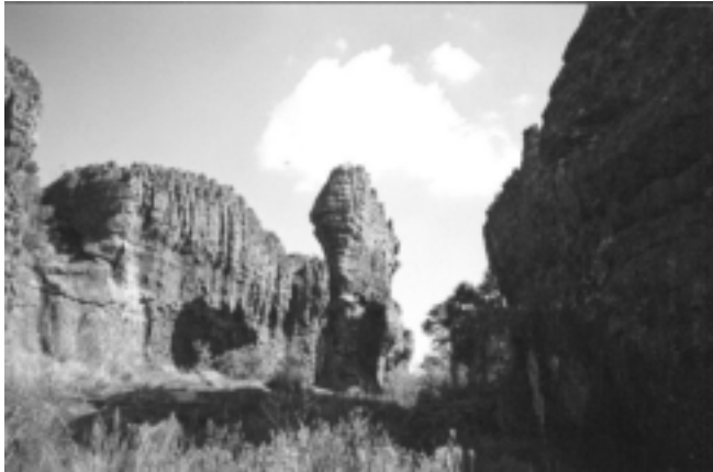
Figura 2 - Arenitos esculturados pelo intemperismo físico e químico