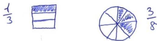
Figura 8 - Representação de razão através de diagramas de área e frações pelo estudante E18