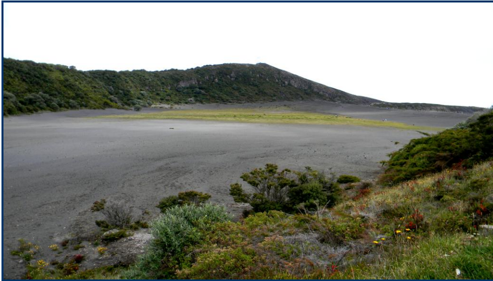
Foto 9: Cratera Diego de La Haya – totalmente preenchida de cinzas, o que possibilita caminhar por ela.