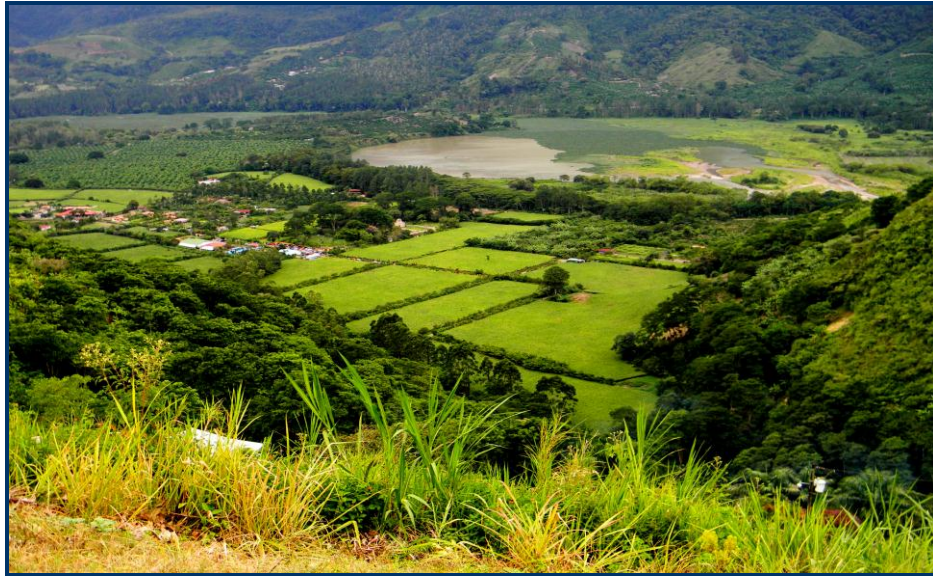
Foto 13: Vista a partir do Mirador Ujarrás (mirante) – no fundo o Embalse de Cachi (represa para produção de hidroeletricidade) no Vale de Ujarrás, com áreas de cultivo