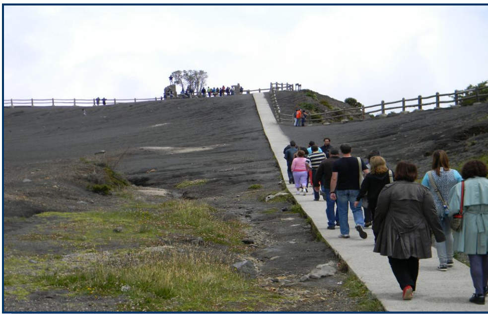
Foto 6: Passarela de acesso às crateras do Irazu – notar o solo escuro formado pelas cinzas do vulcão.