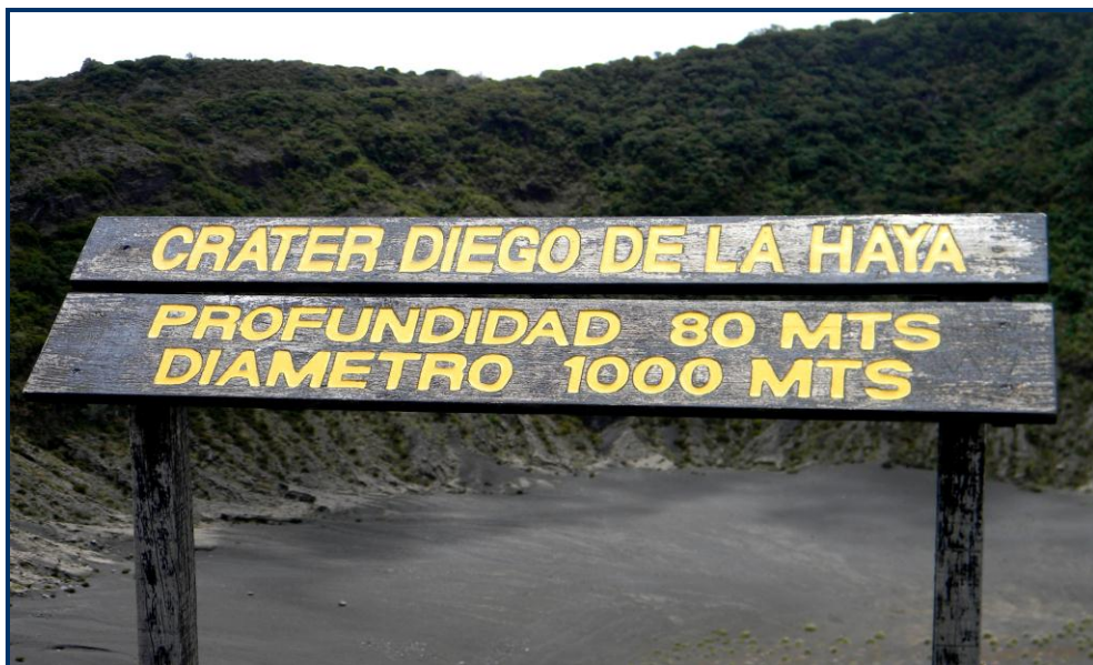
Foto 10: Placa indicativa da cratera Diego da La Haya, do vulcão Irazu.