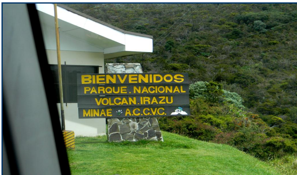
Foto 5: Entrada do Parque Nacional do Vulcão Irazu (3.432 m de altitude).