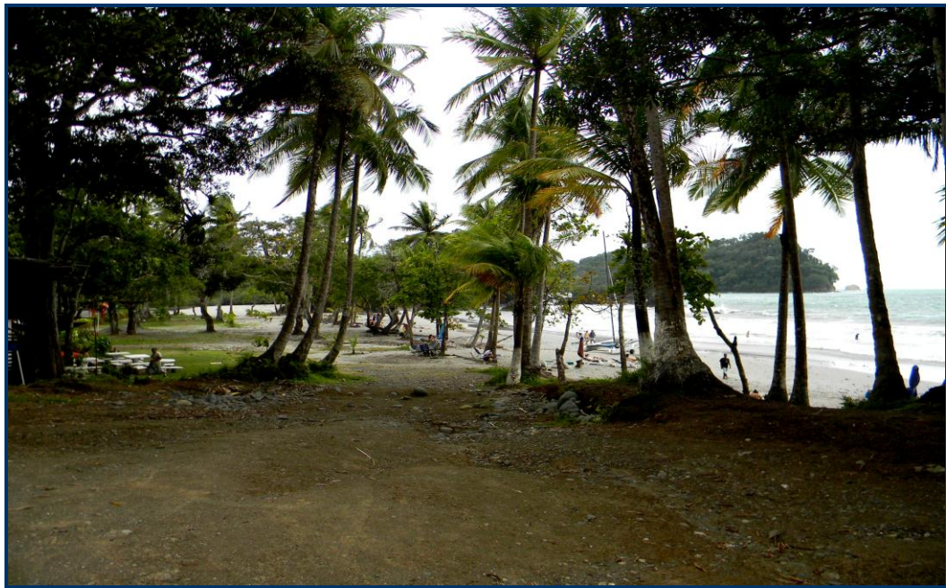
Foto 18: Outro ângulo da praia Manuel Antonio, Costa do Pacífico, Costa Rica.