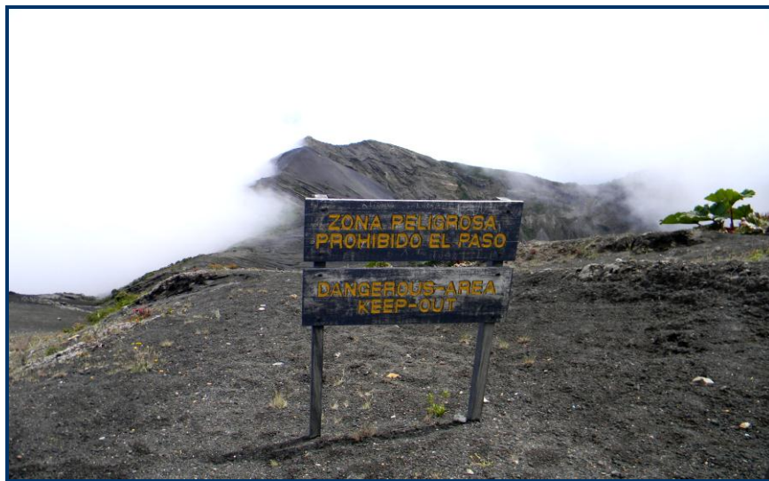
Foto 12: Uma das placas de advertência nas bordas da cratera principal do vulcão Irazu. A qualquer desobediência, a polícia do Parque está atenta para punir os infratores.