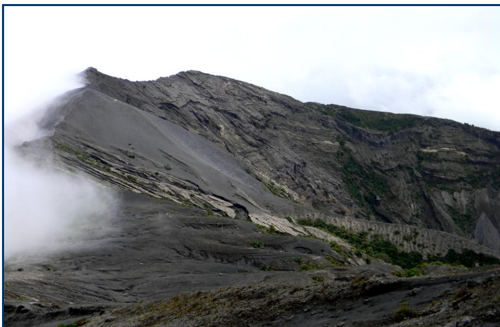
Foto 7: Uma das crateras do vulcão Irazu – 23 erupções desde 1723, sendo as mais recentes registradas em 1963-1965 e em 1972.