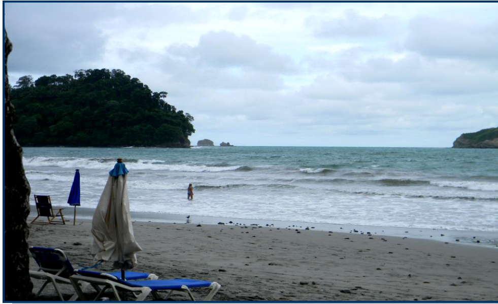
Foto 17: Praia Manuel Antonio, no litoral do Pacífico, muito frequentada por turistas estrangeiros. Fica aproximadamente a 270 Km de San José.