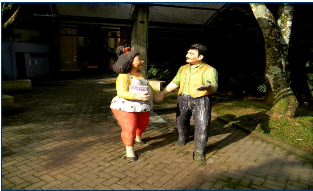
Foto 2: Bonecos de cimento, em tamanho natural, num dos pátios internos do campus. Trata-se de uma peculiaridade local, encontrada em vários pontos da Costa Rica.