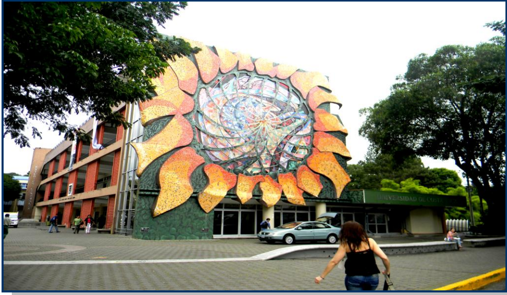
Foto 1: Fachada da entrada do Campus da Universidade da Costa Rica, em San José