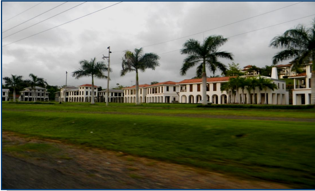
Foto 19: Complexo turístico em construção nas margens da rodovia litorânea (Carretera 34).

Estivemos na Costa Rica, em julho de 2011, participando do XIII Encontro de Geógrafos de América Latina (EGAL). Todas as fotos foram tiradas com uma máquina fotográfica digital amadora NIKON COOLPIX L110, com 12.1 megapixels e zoom 15x.