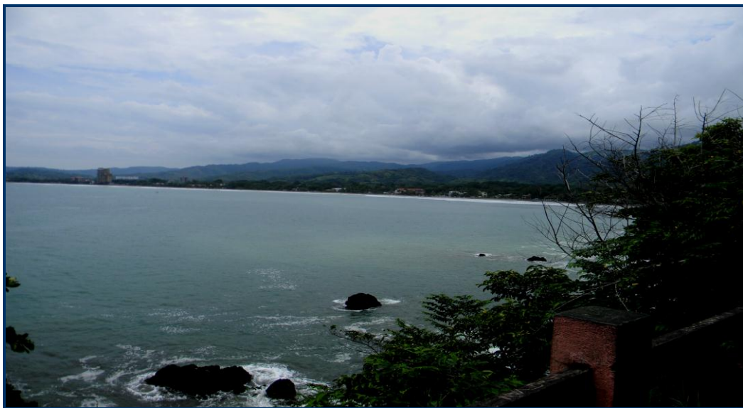
Foto 16: Vista do mirante da Punta de Quepos, litoral do Pacífico, Costa Rica.