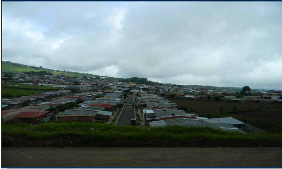
Foto 3: Localidade (Cot) situada na estrada de acesso ao Vulcão Irazu – observar os telhados (todos de flandres que, segundo os costarriquenses, causam menos danos quando ocorrem os terremotos)