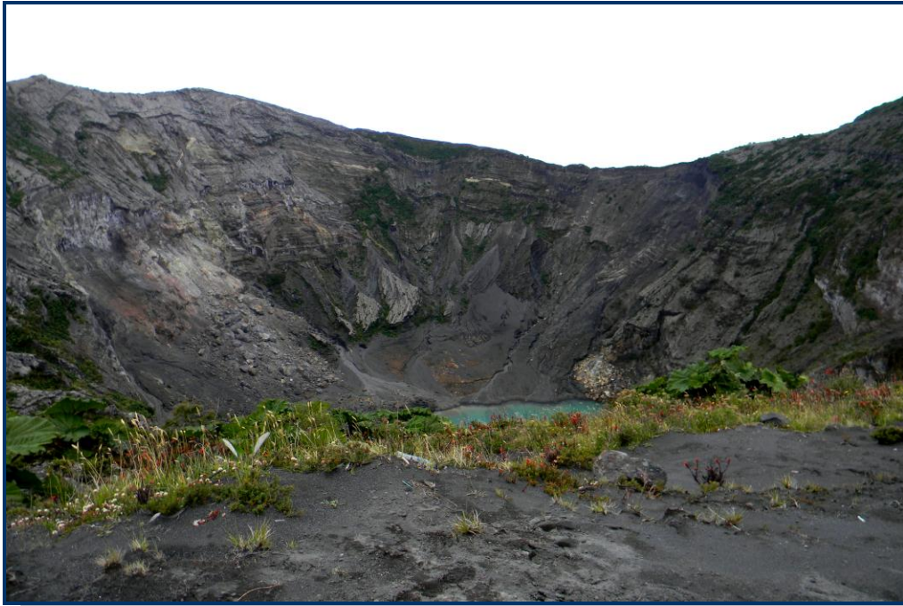
Foto 11: Outro ângulo da cratera principal do vulcão Irazu. No fundo, observa-se um lago, formado pela acumulação de água das chuvas. Nos meses mais secos, o lago desaparece.