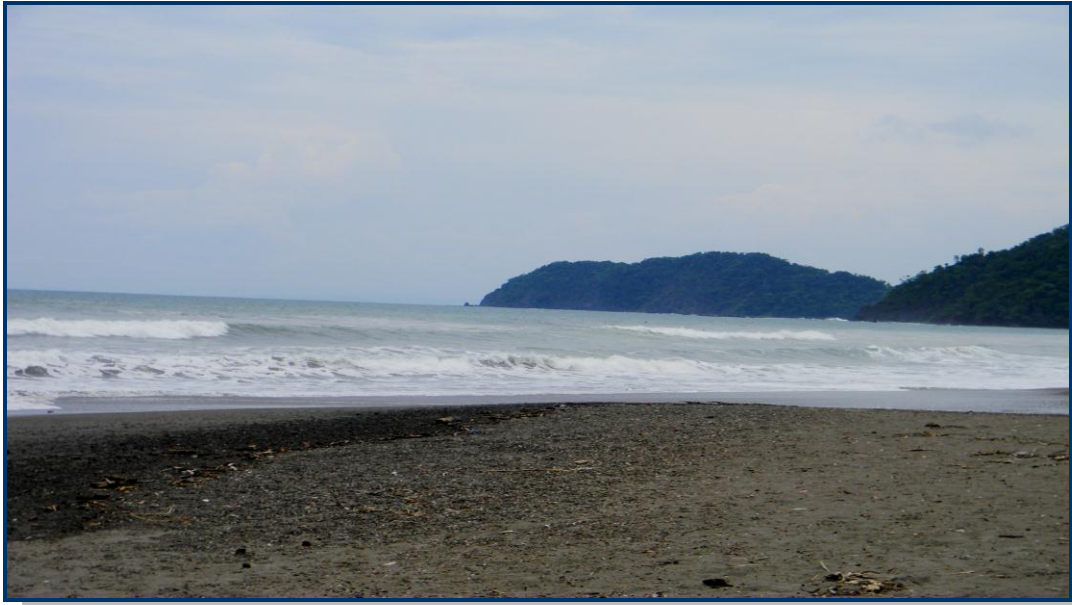
Foto 15: Praia de Jaco, litoral do Pacífico – apresenta areias escuras e água fria – situada a aproximadamente 120 Km de Jan José.