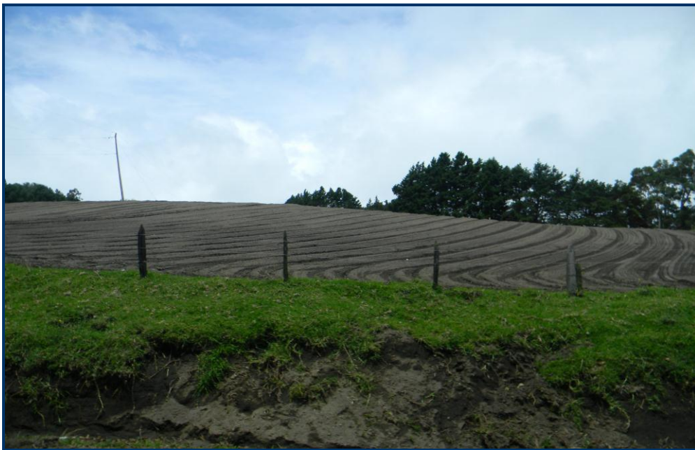
Foto 4: Nas encostas do Vulcão Irazu, solos escuros, ricos em cinzas vulcânicas e férteis para o cultivo (batata e cebola).