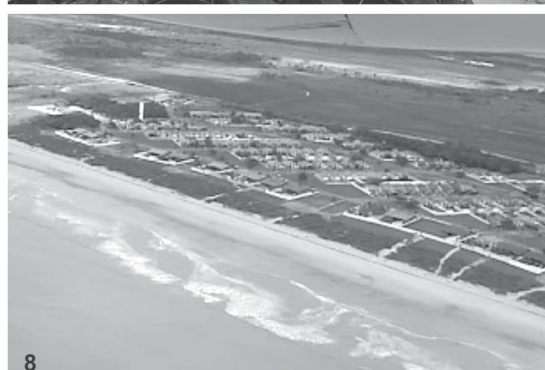
PRANCHA 1. 1: Restos de parede de alvenaria encontrados na praia do Novo Prado. 2: Destruição de uma casa na praia de Guaratiba. 3: Obras de contenção na Ponta das Guaratibas. 4: Restos de uma casa na praia de Barra de Caravelas. 5: Restos de uma casa no Pontal da Barra. 6: Obras de contenção no Pontal da Barra. 7: Casa ameaçada de desmoronamento no topo da falésia na praia da Costa Dourada. 8: Condomínio residencial na praia do Por-do-Sol, onde é observada uma faixa de recuo de aproximadamente 50 m entre a primeira linha de construções e a linha de costa. Localização dos pontos na Figura 1.