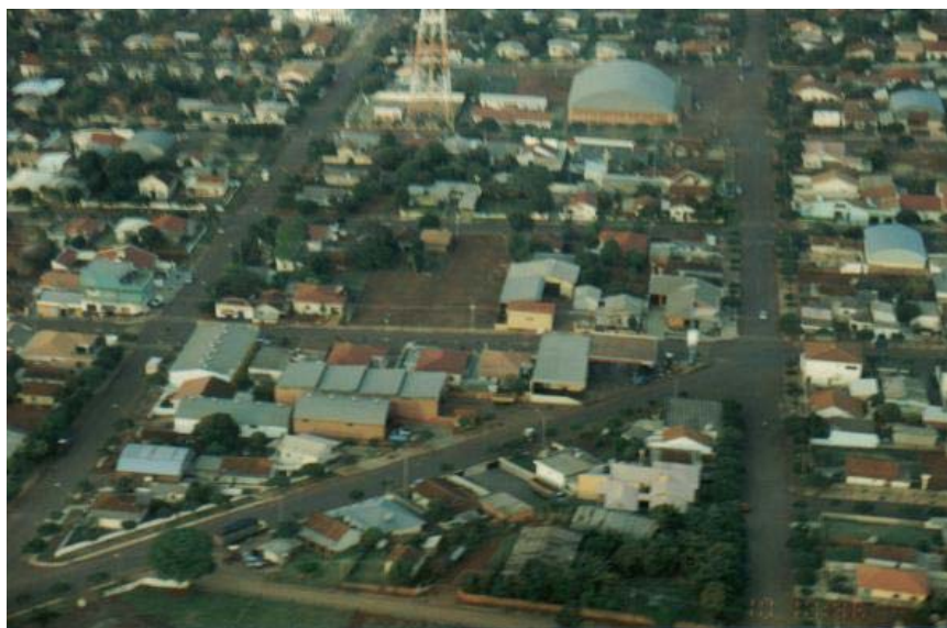
Figura 1. Vista parcial da cidade de Boa Esperança – Paraná.

O município de Boa Esperança (Figura 1) localiza-se na Região do Noroeste Paranaense, na Região Sul do Brasil, em altitude de 550 metros acima do nível do mar, sendo a sede do município localizada em latitude 24° 13' e 30" Sul, longitude de 52° 47'e 30" Oeste, e com uma área de 311, 225 km 2 (BRASIL, 2000).