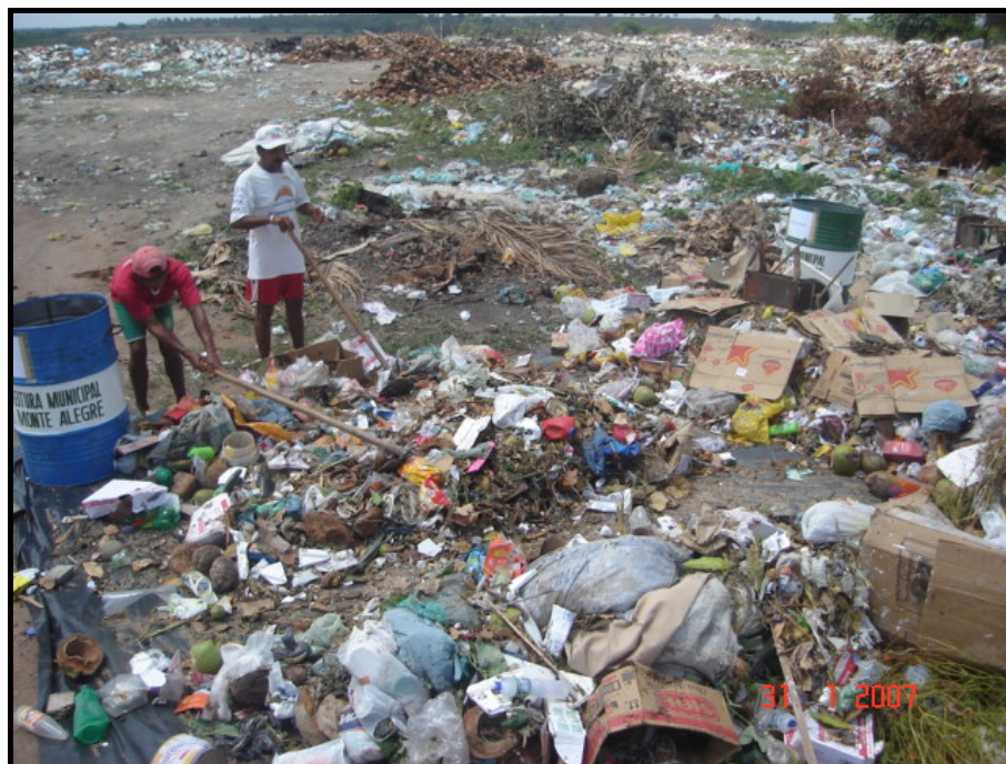
Figura 2. Quarteamento dos RSU's de Monte Alegre.

As amostragens foram realizadas no lixão municipal de Monte Alegre, localizado no bairro da Esperança, sendo coletadas em caminhões abertos que trouxeram os resíduos dos setores representativos da cidade. O conteúdo do caminhão foi disposto em local plano, sendo depositados os resíduos na lona preta e moldados em forma de uma leira piramidal.