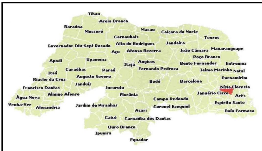
Figura 3. Mapa do Rio Grande do Norte – Localização Monte Alegre

cerca de 40 km, sendo seu acesso, a partir de Natal, efetuado através das rodovias pavimentadas BR-101 e RN-002.