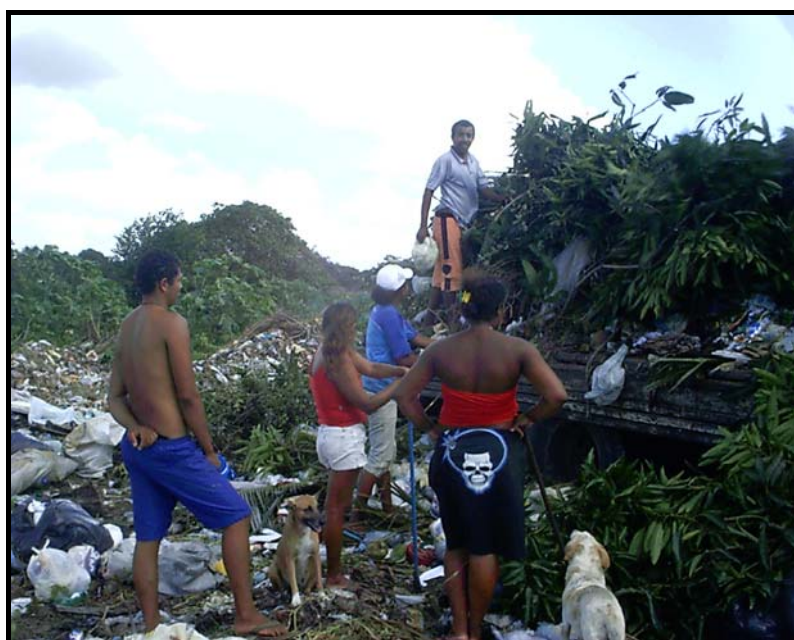
Figura 8. Presença de pessoas e animais no Lixão. Foto: Rafaella Iliana Alves Arcila, Outubro/ 2007.

Não sendo exercido nenhum tipo de controle, por parte da Prefeitura, a área do lixão fica aberta para descargas desconhecidas e também para o acesso da população menos favorecida. Como sendo comum em todos os lixões, em Monte Alegre, também, há registro da presença de pessoas e animais domésticos, por sob o lixão, conforme figura 8, estando esses a buscarem alimentos e outros produtos, correndo riscos de contaminação através de agentes químicos e biológicos agressivos.