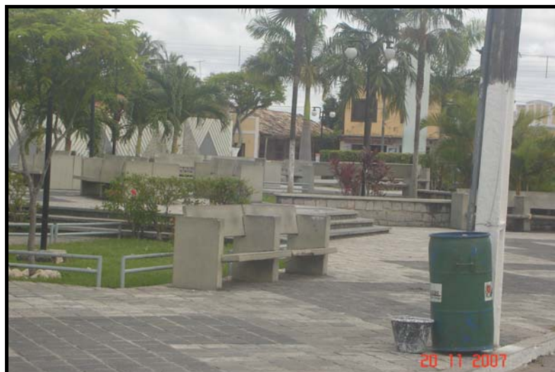
Figura 5. Latão de lixo da praça Foto: Rafaella Iliana Alves Arcila, 2007.

O sistema de limpeza urbana (LU) do município é administrado pela Secretaria de Obras, havendo um setor responsável para tal. O referido setor limita-se a realizar o trabalho que se estende desde a coleta nas residências e comércio, varrição, capina, limpeza de canteiros, pintura de meio-fio até a disposição final dos resíduos no lixão.