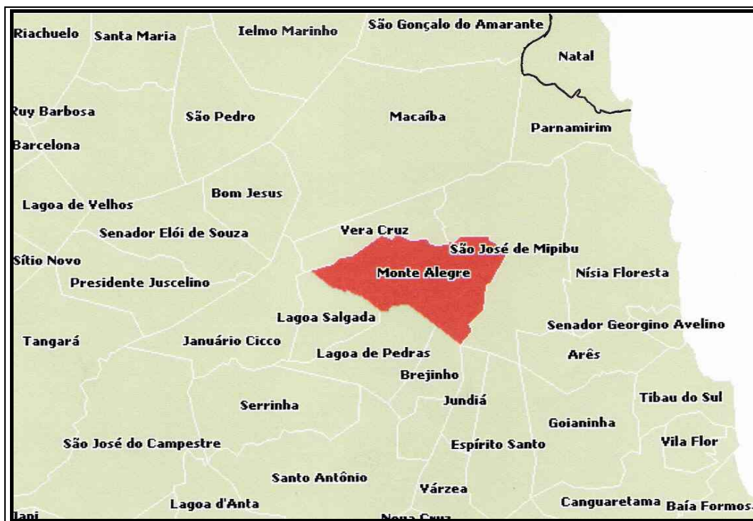
Figura 4. Mapa Monte Alegre em destaque