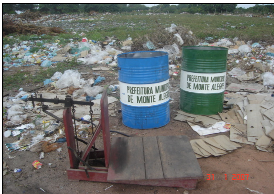
Figura 1. Latões e balança usados na amostragem Foto: Rafaella Iliana Alves Arcila, 2007.

A metodologia empregada para amostragens e caracterização física dos RSU foi o quarteamento, sendo a mesma utilizada pela Universidade Federal de Viçosa – UFV, Minas Gerais, que conta com o Laboratório de Engenharia Sanitária e Ambiental - LESA, centro de referência na América Latina em Resíduos Sólidos em Municípios de Pequeno Porte.