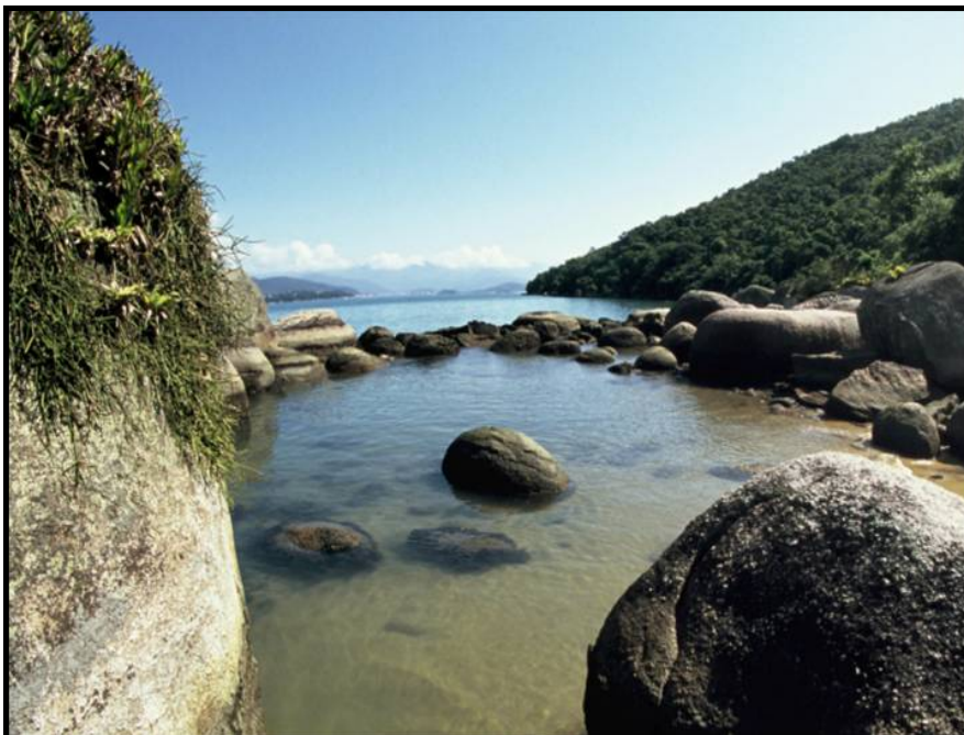
Figura 2 – Vista geral da área onde é realizada a atividade “Aquário Natural”, conhecida como Piscina Natural, Parque Estadual da Ilha Anchieta, Ubatuba, SP. Foto: Tony Fleury (2006).