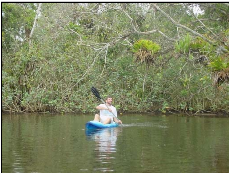
Figura 5 – A atividade “Trilha com caiaques no Manguezal”, realizada no manguezal da Praia Dura, Ubatuba, SP. Foto: Natalia Pirani Ghilardi (2004).

3) Praia Dura (Ubatuba, SP): no manguezal foi realizada a “Trilha em Caiaque” (Figura 5).