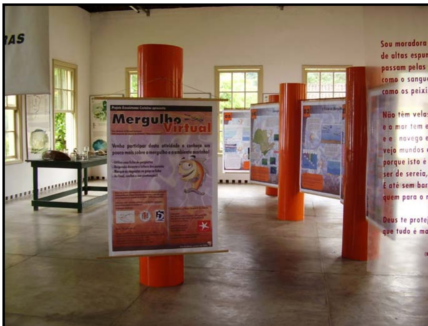
Figura 3 – Vista geral da área onde é realizada a atividade “Mergulho Virtual”, Parque Estadual da Ilha Anchieta, Ubatuba, SP.

2) CEBIMar-USP (São Sebastião, SP), local que também é uma área de conservação ambiental: na enseada correspondente à Praia do Segredo (Figura 4), que possui características ideais de segurança, sendo pequena, fechada e com baixo hidrodinamismo na maior parte do tempo, foi aplicado o modelo de “Visitação Monitorada”.