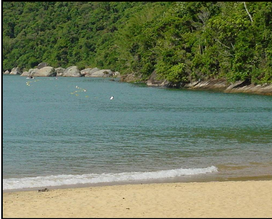
Figura 1 – Vista geral da área onde são realizadas as atividades “Trilha Subaquática com Mergulho Livre” e “Trilha Subaquática com Mergulho Autônomo”, trecho de 350 m de costão situado entre a Praia do Presídio e Praia do Engenho, Parque Estadual da Ilha Anchieta, Ubatuba, SP. Foto: Flávio Berchez (2003).