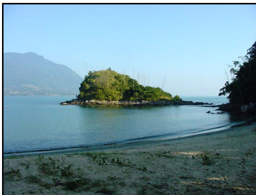
Figura 4 – Vista geral da área onde é realizada a atividade “Visita Monitorada”, na Praia do Segredo, CEBIMar-USP, São Sebastião, SP.

2) CEBIMar-USP (São Sebastião, SP), local que também é uma área de conservação ambiental: na enseada correspondente à Praia do Segredo (Figura 4), que possui características ideais de segurança, sendo pequena, fechada e com baixo hidrodinamismo na maior parte do tempo, foi aplicado o modelo de “Visitação Monitorada”.