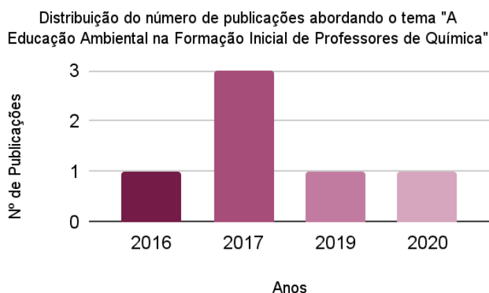
Figura 1 - Número de publicações por ano

As singularidades obtidas configuram elementos essenciais ao entendimento e apresentação das evidências acerca da temática em nível nacional. Os primeiros aspectos apresentados, ainda nos Quadros 2 e 3, indicam a periodicidade dos trabalhos divulgados sobre EA e formação de professores de Química nas fontes pesquisadas ao longo de dez anos. A Figura 1 evidencia o número de trabalhos produzidos por ano: