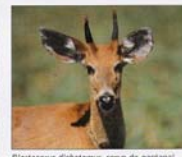
Blastocercus dichotomus , cervo-do-garimalei

O que deseja a continuidade de efetuação desse estilo de pensamento com a representação?