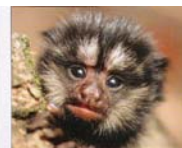
Callithrix penicillata , sagüí-de-tufos-pretos